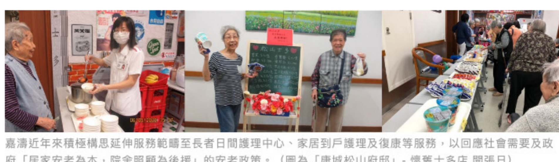
嘉濤近年來積極構思延伸服務範疇至長者日間護理中心、家居到戶護理及復康等服務，以回應社會需要及政府「居家安老為本，院舍照顧為後援」的安老政策。（圖為「康城松山府邸」- 懷舊士多店 開張日）

「社區券」為日間缺乏家人照顧的體弱長者提供專業的照顧和適切的康樂文化活動，以協助體弱長者留在家中及社區生活。持有「社區券」的長者，每月可因應自身需求，自由選擇個人服務組合，當中包括日間護理及家居到戶照顧服務。