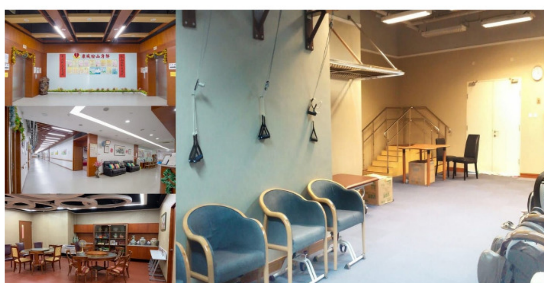
（圖為「康城松山府邸」室內環境）

「社區券」為日間缺乏家人照顧的體弱長者提供專業的照顧和適切的康樂文化活動，以協助體弱長者留在家中及社區生活。持有「社區券」的長者，每月可因應自身需求，自由選擇個人服務組合，當中包括日間護理及家居到戶照顧服務。