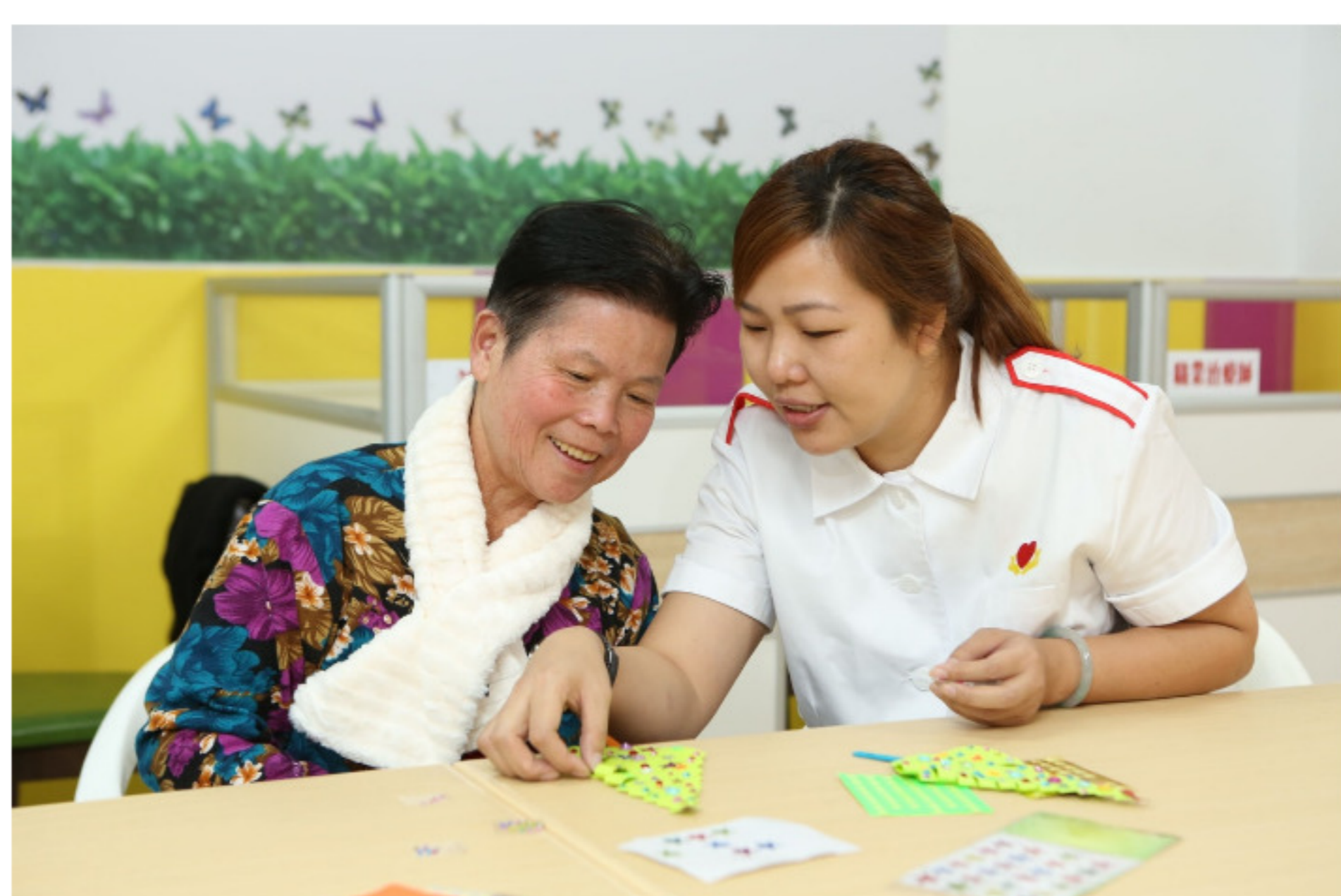
扎根香港29年的嘉濤（香港）控股有限公司（下稱「嘉濤」，前身為「嘉濤安老集團」），現提供合共100個長者日間護理服務名額，以及800個家居照顧服務名額。（圖為「嘉濤耆樂苑」生活隨影）

值得一提的是，在179間社署認可的服務機構中，「嘉濤（香港）控股有限公司」是唯一的一家上市公司，1991年成立，也是香港歷史悠久的大型護老集團。嘉濤於2020年初更成為了「社區券」認可服務提供機構之一，提供中心為本或家居為本，兩項服務。中心為本即長者日間中心，家居為本即家居照顧服務，包括一對一上門照顧。除了質素較有保證外，現仍有大量配額提供服務。所以的確值得大家參考參考。