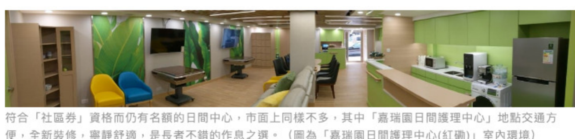
符合「社區券」資格而仍有名額的日間中心，市面上同樣不多，其中「嘉瑞園日間護理中心」地點交通方便，全新裝修，寧靜舒適，是長者不錯的作息之選。（圖為「嘉瑞園日間護理中心(紅磡)」室內環境）