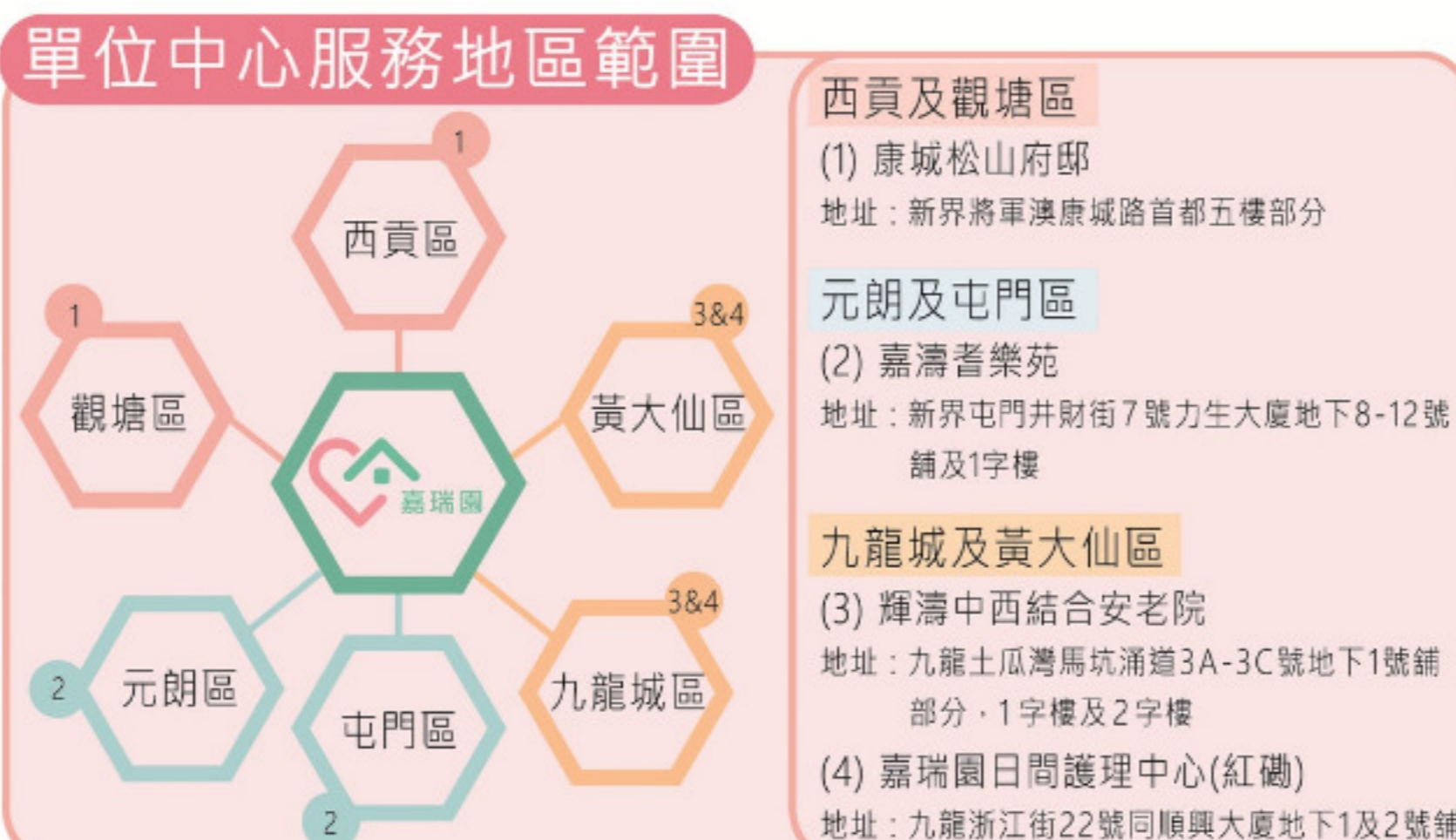
（圖為「嘉濤」日間服務地區範圍及中心/單位地址）

嘉濤除了旗下的護理安老院（「康城松山府邸」、「輝濤中西結合安老院」和「嘉濤耆樂苑」）成為「社區券」認可服務單位外，還有致力以中心為本及家居為本模式提供社區照顧服務而成立的新品牌：「嘉瑞園」和「護老易(CARE EASY)」。